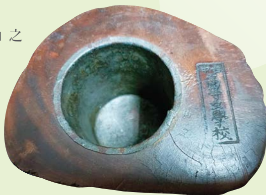
▶ 刻有「台中高等女學校」之 實木樹頭製花器 - 正上方