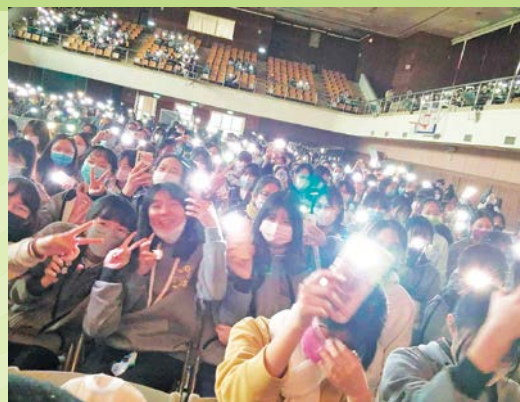
同學打開燈光和著歌聲