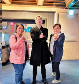
散場後與孫女婿一起合影