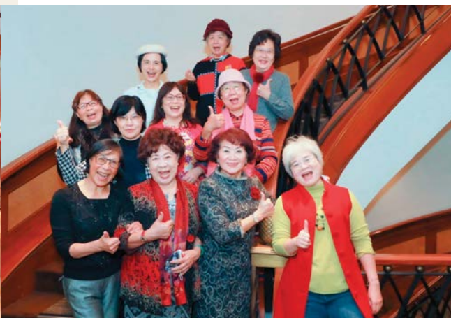
2023年春酒理監事合照