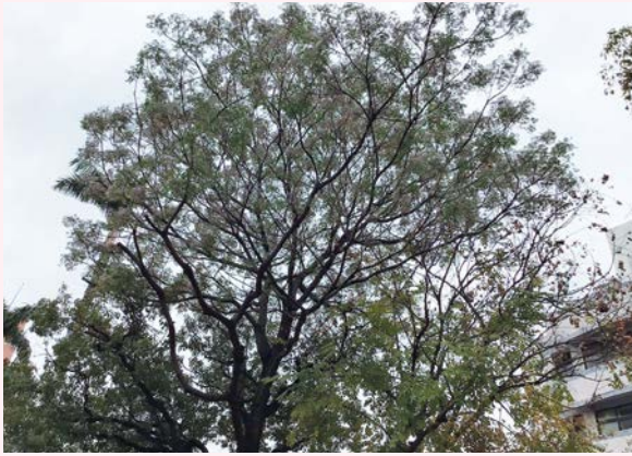
操場邊滿開的苦楝(攝於 2023/3/13)