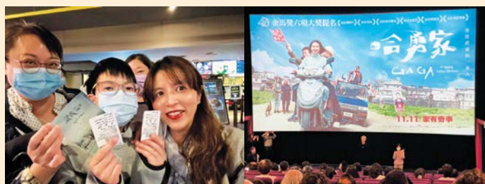
跟同學一起看電影，一起感動 映後座談—孫女婿來聊聊

而土地重劃與選舉事件的發生，對於哈勇這一家，像是投入了大小不一的石頭進到核心湖中。震盪之後，在樂天知足的天性下，雖有著淡淡的無奈在其中，但以愛襯底，親情終究是最終的依歸。