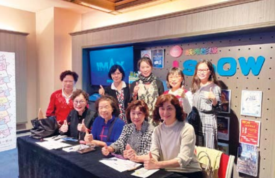
感謝校友會學姐們包場