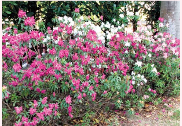
前門圍牆內開始凋謝的杜鵑 (攝於 2023/4/17)