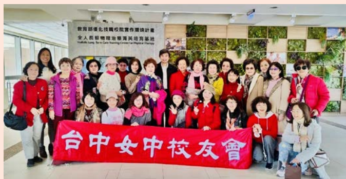
參觀全人照顧物理治療菁英培育基地

一、圖書館數位化資源系統，室內空間設計新穎，色彩鮮明，設有獨立式包廂卡座區、階梯區、30 人會議室、桌遊室、多媒體互動體驗室、藝術廊道、討論室、靜音學習區...等多元享學空間，已具備五星級的設備，充分提供學生舒適雅靜的學習環境。