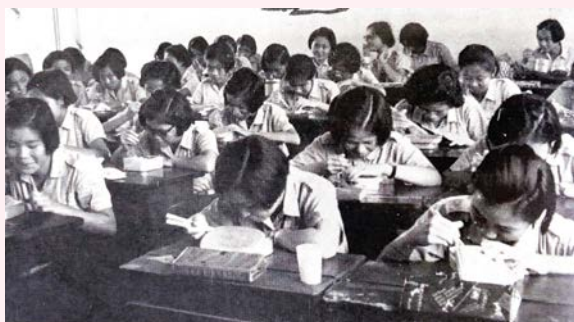
學生宿舍 抬便當了～ 吃便當了～