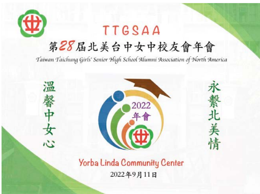
第28屆北美台中女中校友會年會會旗

自從台中女中畢業，北上就讀陽明醫學大學後，我因為忙於課業就比較沒有機會再回到中女中母校探望。之後來到美國求學成家，又幾經搬遷，逐漸和高中的同學們失去了聯繫，也慢慢遠離了高中時代天真無邪的青春年華。轉眼在美國中西部住了30多年，直到前幾年孩子們都完成學業，並各自有了不錯的穩定工作後，我和先生總算完成了我們階段性的責任，於是退休搬到了心目中嚮往已久的退休天堂－南加州。在人生地不熟的加州我很高興能尋找到北美台中女中校友會，不但聯繫上了舊同學也認識了很多新朋友，讓生活變得多采多姿。