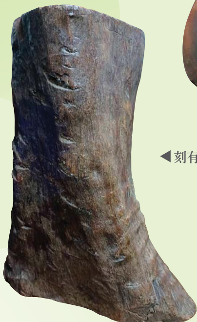
◀ 刻有「台中高等女學校」之實木樹頭製花器