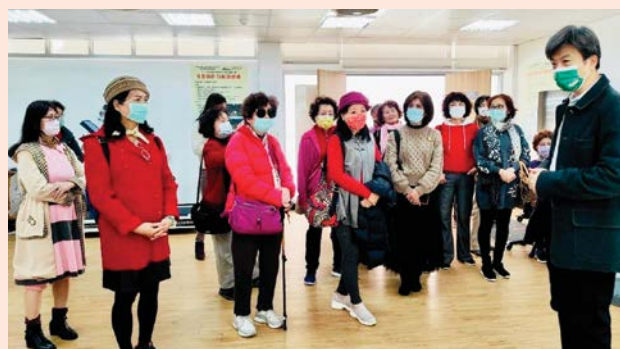
全人照顧物理基地導覽