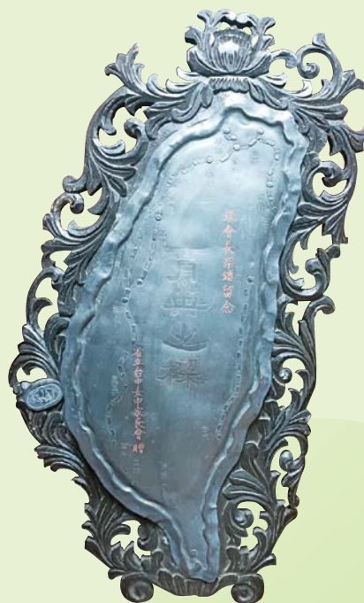
▲ 「省立台中女中家長會贈」之 台灣造型銅雕藝術品