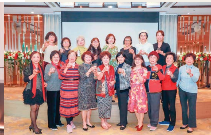
理事長_理監事舉杯祝福