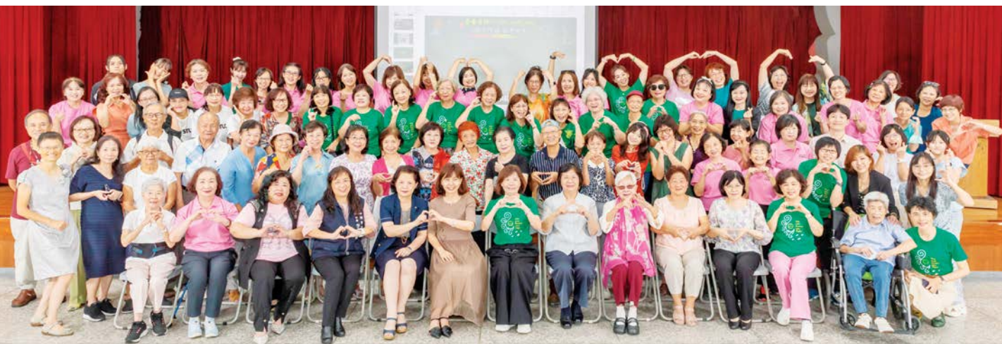
20250919 台中女中校友會 吾愛吾師 "To Sirs with Love"活動留影

跨世代、跨領域的中女學姊妹不只要箍在一起，在一次又一次的相聚中更要甲妳攬牢牢，乎我陪妳唱同調，乎我陪妳唱同一首歌……乎我甲妳攬牢牢。