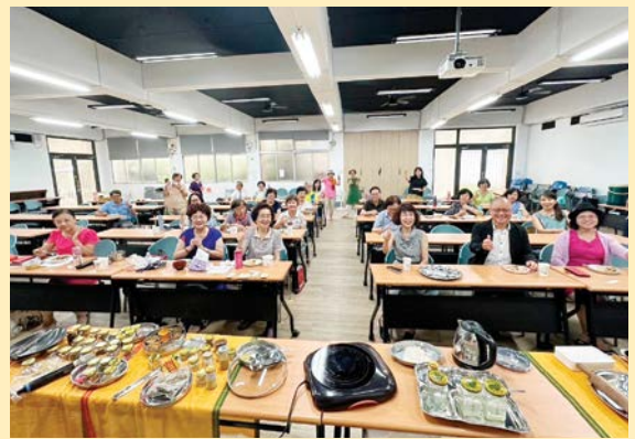
來玩印度料理在綠苑講堂

除了料理外，有趣莫名其妙的印度文化，也是活動的重點。怎麼用手吃飯，為什麼用手吃飯？印度人為什麼喜歡搖頭？還有額頭上的那個紅點究竟是什麼意思？印度日常很多是修行轉日常，就是在日常行為中同時修行，而印度修行最終的目標就是：沒有下輩子！關於多神教的印度，號稱有 3 千 3 百萬個神，而說到神，就一定會提到神的甜點：拉都球 Ladoo。賓森拉都球，是蛋白質的甜點，由黑鷹嘴豆粉、堅果加上 Ghee 淨化奶油與糖粉製作而成，吃下去香氣在口中久久不散。吃下去的熟悉感，也令大家不斷思考，究竟跟什麼台灣食物很像呢？！